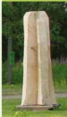
Double arch Mari Shields

The exhibition is organised by Mikkeliipuisto Park Association, Saksala ArtRadius and POAM Penttilä Open Air Museum together with partners. The organisers welcome you to visit them!